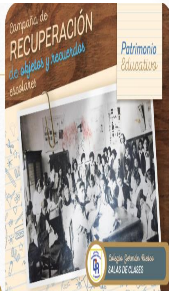
Colegio Germán Riesco SALAS DE CLASES