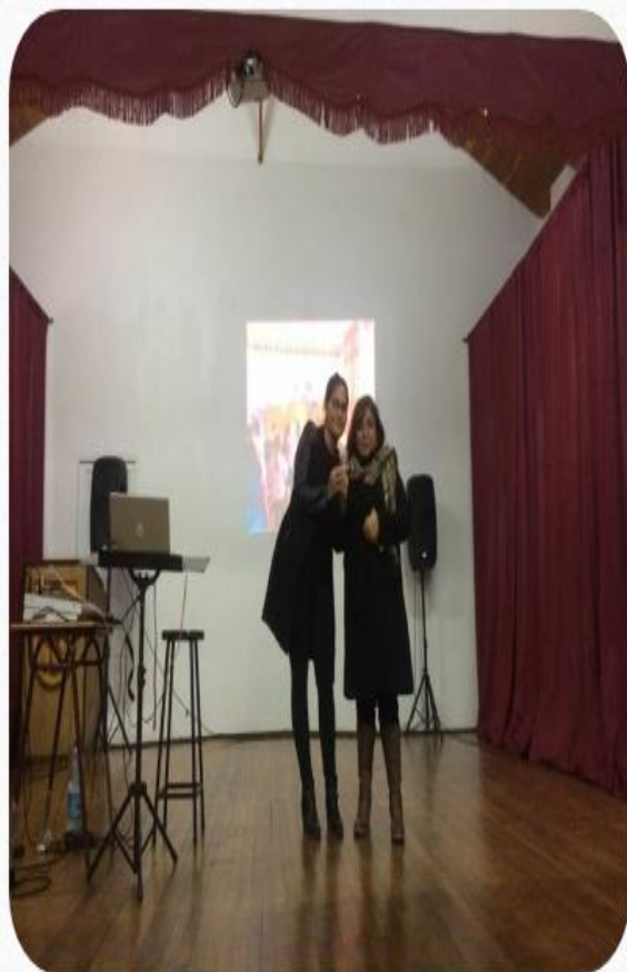
Donaciones de ex estudiantes Año 2018 Onces del Recuerdo (Entrega Insignia)