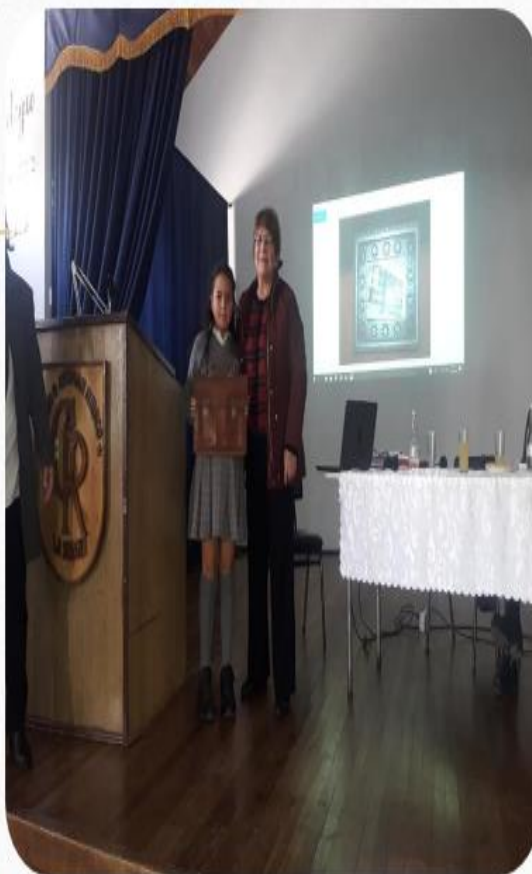
Donaciones Profesoras Jubiladas III Encuentro Germaniano 2019