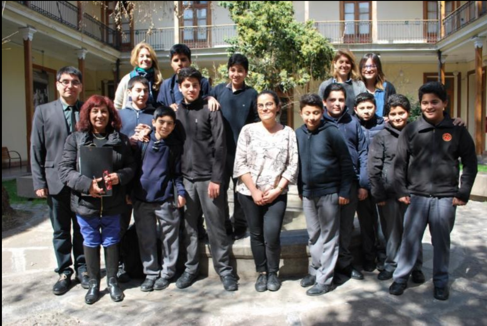
Equipo del Taller Patrimonial, octubre 2016