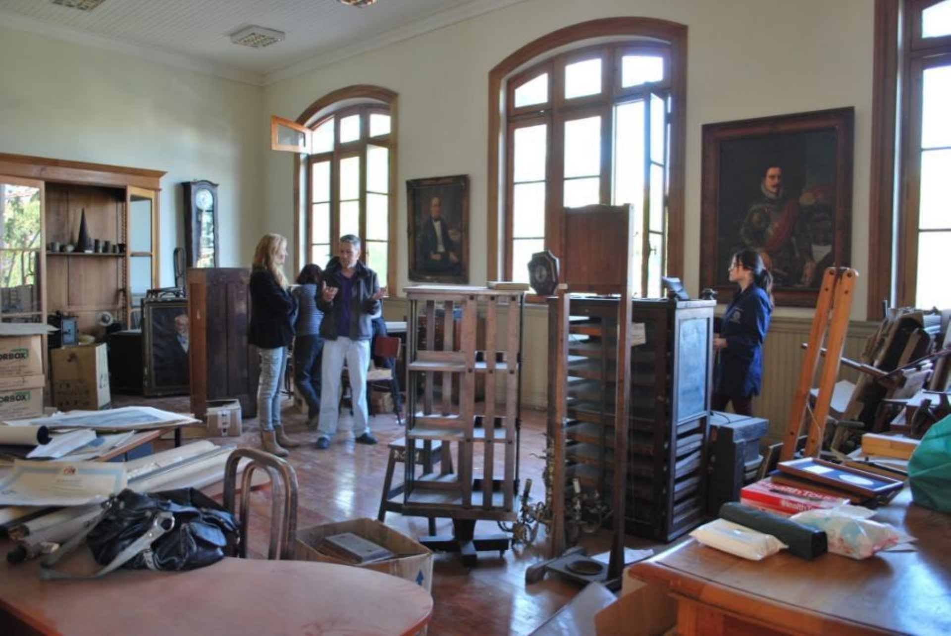
Estado inicial, Sala Patrimonial Gabinete de Ciencias, marzo 2016.