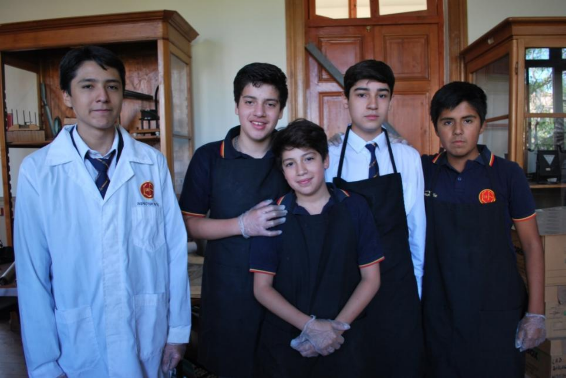
Estudiantes del Taller Patrimonial, marzo 2016.