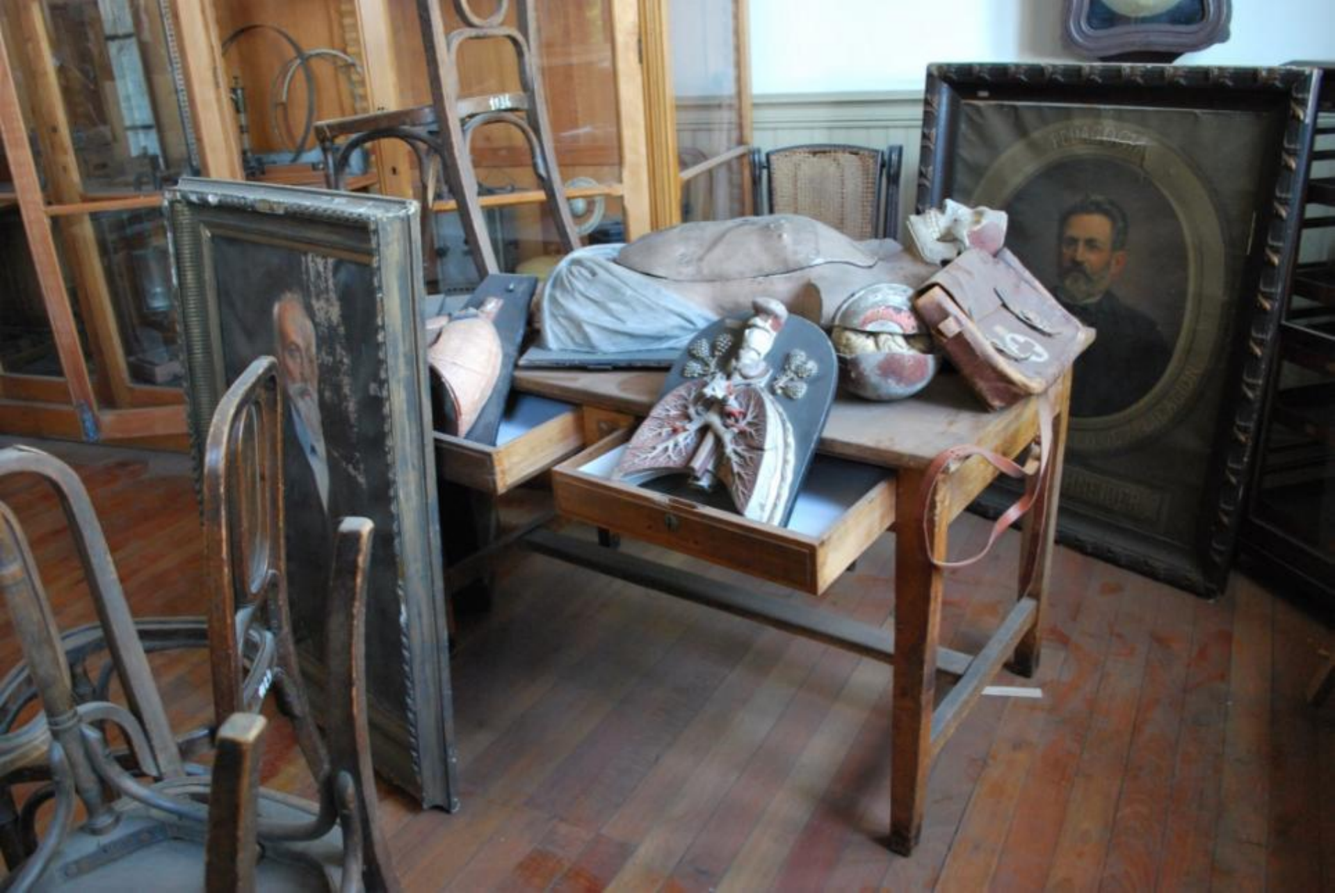
Estado inicial, Sala Patrimonial Gabinete de Ciencias, marzo 2016.