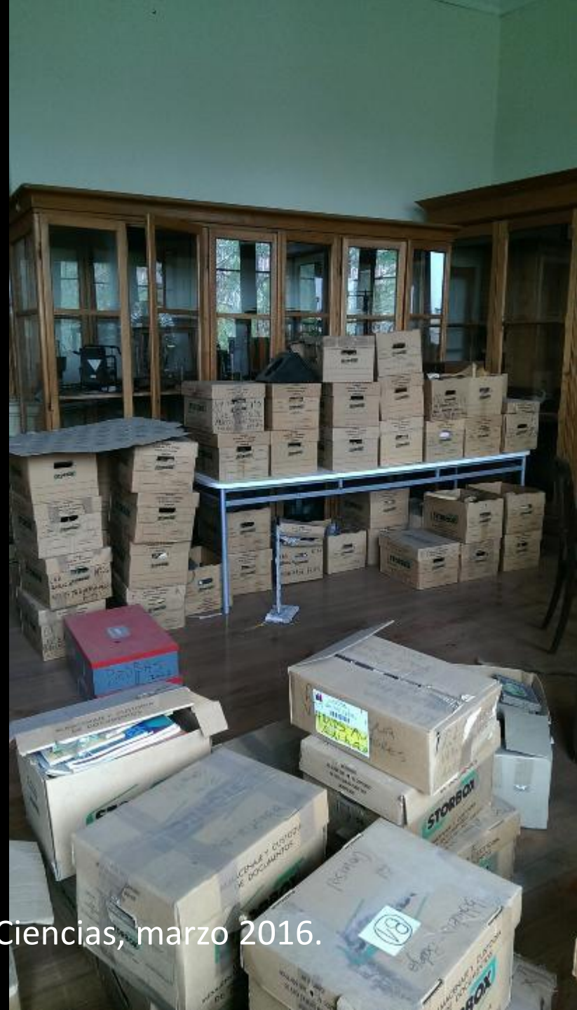
Estado inicial, Sala Patrimonial Gabinete de Ciencias, marzo 2016.