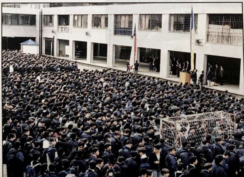
Inicio del año escolar

La seguridad y la higiene son factores que se deben considerar en el proceso educativo; el reacondicionamiento de camarines y las duchas con agua caliente han sido una importante contribución para el adecuado desarrollo de las actividades de Educación Física durante la jornada de clases.