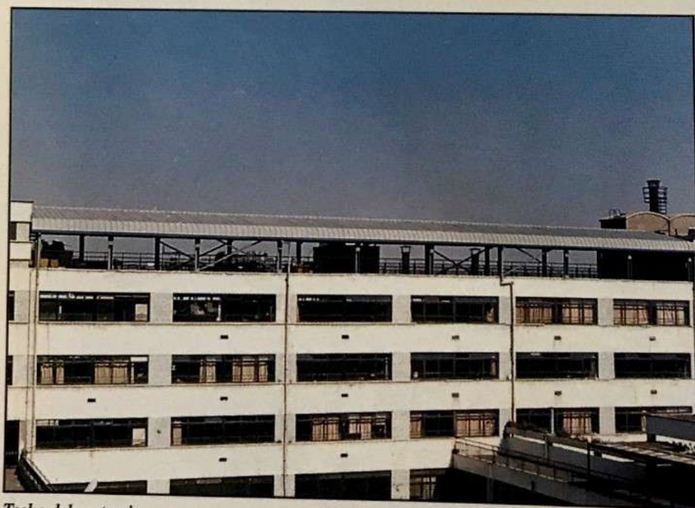
Techo del sexto piso

Las condiciones estructurales de la terraza del cuarto piso ha demandado grandes recursos para dar condiciones de seguridad al juego de los alumnos y a la vez solucionar el problema de filtración de aguas lluvias.