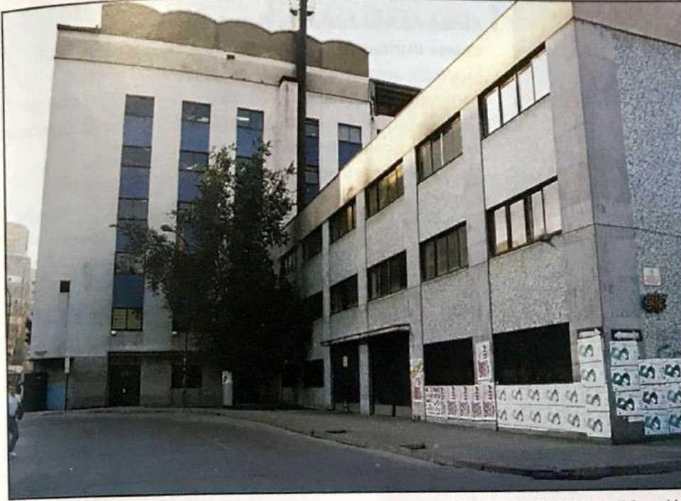
Edificio de la SEREMI de Educación

Una sentida preocupación de la Comunidad Institutana es la recuperación de todas sus dependencias, el progresivo incremento de las actividades académicas y administrativas hace necesario redoblar las gestiones para reincorporar el área ocupada por la Secretaría Ministerial de Educación y por SERBIMA.