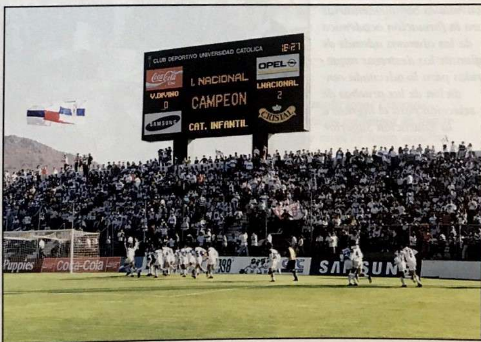
Rama de fútbol

Las actividades deportivas forman parte importante del currículo escolar; a través de ellas los alumnos conviven con estudiantes de otros establecimientos educacionales logrando significativos aprendizajes y grandes satisfacciones con los triunfos obtenidos en las diversas ramas deportivas.