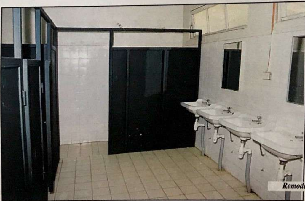
Remodelación de los baños

En el refugio El Tabo se ha hecho una inversión cercana a los $ 30.000.000 en el reacondicionamiento total de las dependencias, lo que posibilita acoger de manera adecuada a la Comunidad Institutana, en particular a nuestros alumnos.