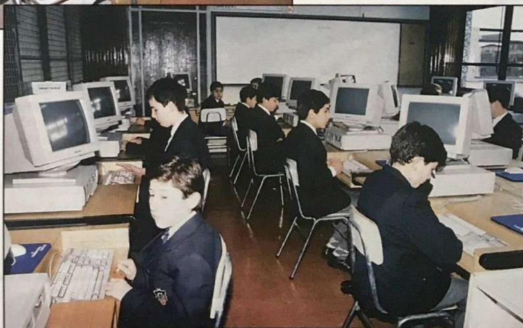
Laboratorio de computación

La habilitación de dos laboratorios de computación, con un renovado equipamiento, abre una posibilidad cierta a la incorporación de nuevas metodologías curriculares. En el último año, a través de actividades de taller, se ha entregado una capacitación básica a más de 1.700 alumnos.