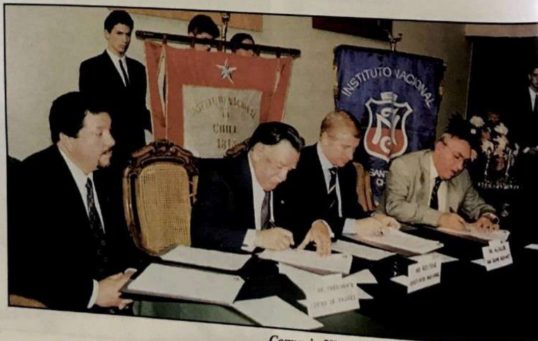
Convenio UMCE-Municipalidad- Centro de Padre

Un serio problema en los últimos años, ha sido la movilidad de los profesores que provoca retrasos y vacíos en el desarrollo de los programas de estudios. Una iniciativa para resolver este problema ha sido la firma de convenios de asistencia pedagógica entre la UMCE y la DEM con el Centro de Padres.