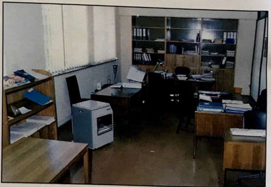
Oficina de U.T.P.

El reacondicionamiento de oficinas y Departamentos de Asignatura ha procurado mejores condiciones para el trabajo administrativo, el desarrollo de las actividades técnico pedagógicas y la adecuada atención de alumnos y apoderados.