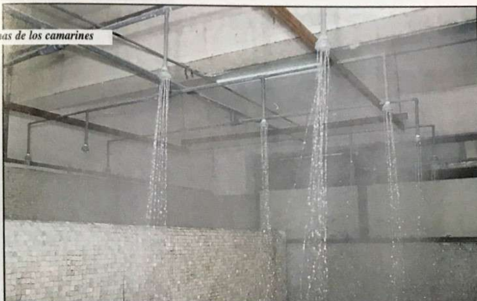
Duchas de los camarines

La seguridad y la higiene son factores que se deben considerar en el proceso educativo; el reacondicionamiento de camarines y las duchas con agua caliente han sido una importante contribución para el adecuado desarrollo de las actividades de Educación Física durante la jornada de clases.