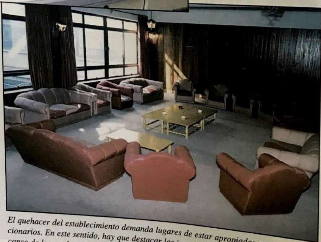
Sala de estar de profesores

La renovación tecnológica de los Laboratorios de Ciencias, con un valor estimado de $ 122.000.000, constituye un gran aporte que se traducirá en la introducción de nuevas metodologías para la enseñanza de las ciencias, situando al Instituto en una posición privilegiada en el ámbito educacional.