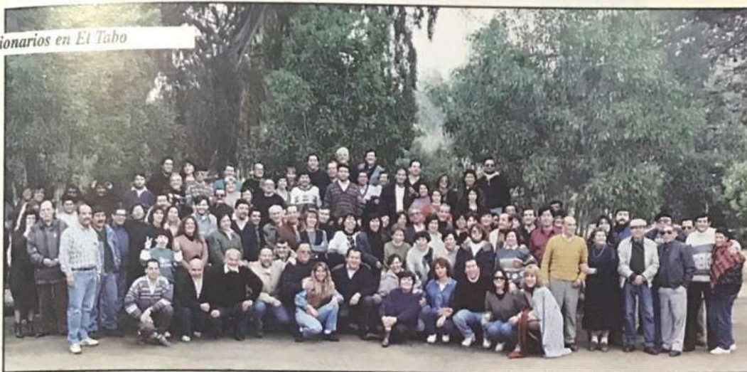
Funcionarios en El Tabo

Los niveles de logro que exhibe el Instituto Nacional en el ámbito académico son producto de una fórmula simple: la capacidad de sus alumnos sumada a la calidad profesional del Cuerpo de Profesores y Funcionarios No Docentes del Establecimiento.