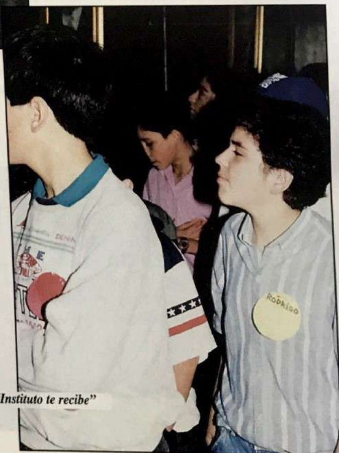
El "Instituto te recibe"

Los alumnos que ingresan a Séptimo Básico son recibidos a través del programa "El Instituto te recibe", con un plan de actividades que facilita su integración brindándoles la oportunidad de conocer por dentro nuestro colegio, comenzando a impregnarse así de la mística Institutana.