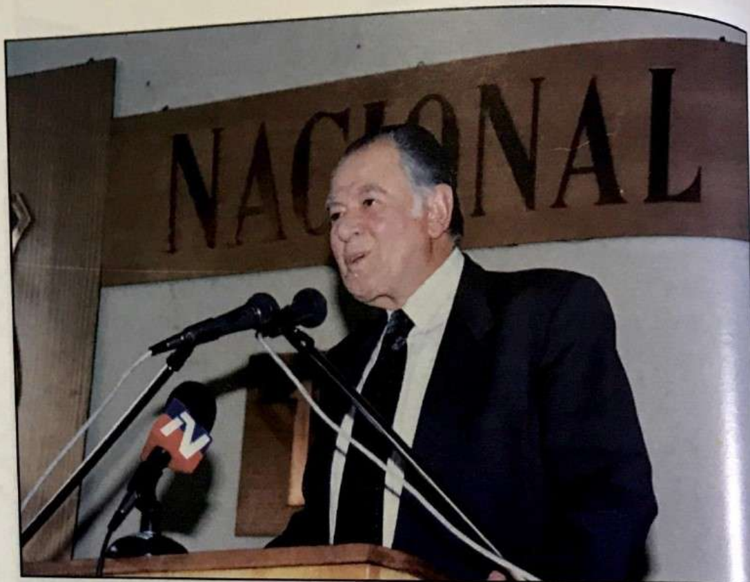
Clase Magistral de Patricio Aylwin

Las actividades de extensión cultural son un importante factor en la formación de los alumnos; entre ellas hay que destacar, el encuentro con notables personalidades de la vida pública nacional, con quienes los alumnos han tenido la oportunidad de dialogar y aprender de sus experiencias.